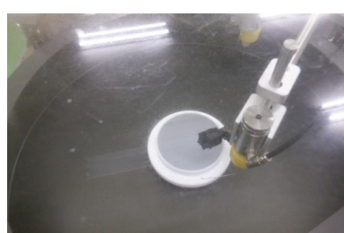
Port 2 稼働