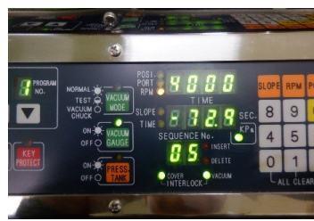
運転中4000回転 回転数確認(4000rpm)