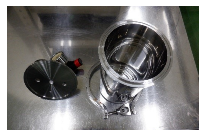
付属SUSタンク(パッキン無)